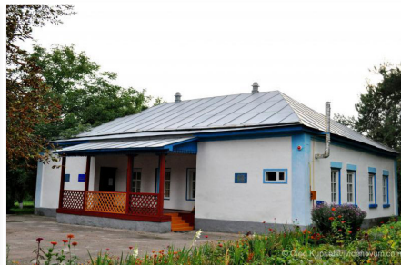
Іржавецький музей-садиба Левка Ревуцького