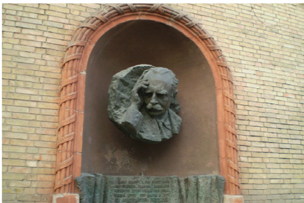
Меморіальна дошка Левка Ревуцького на будинку по вул. Софійській, 16 у Києві

Створена Левком Ревуцьким композиторська школа стала потужною силою української музичної культури другої половини ХХ ст. До першого 10-річчя незалежності України імена Левка Ревуцького та його брата Дмитра посіли достойне місце у списку 100 найвидатніших українців, починаючи від князя Володимира, гетьмана Богдана Хмельницького й до наших днів.