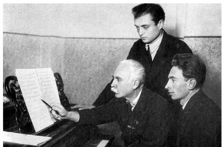
Левко Ревуцький з учнями Анатолієм Коломійцем та Віталієм Кирейком (1947 р.)

Під час Другої світової війни Ревуцький певний час жив в евакуації, був керівником кафедри історії й теорії музики Ташкентської консерваторії. В цей період композитор створив багато музичних творів на військово-патріотичну тематику. Його син Євген воював на Московському фронті, отримав тяжке поранення, а брата Дмитра 29 грудня 1941 року було жорстко вбито в Києві.