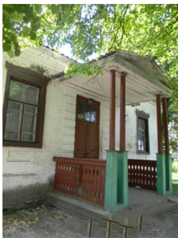
Школа у якій навчався майбутній письменник

спочатку складалися важко, а потім стали прикладом сильної, світової братерської любові, – можна прочитати в спогадах молодшого брата Григора Тютюнника «Коріння».