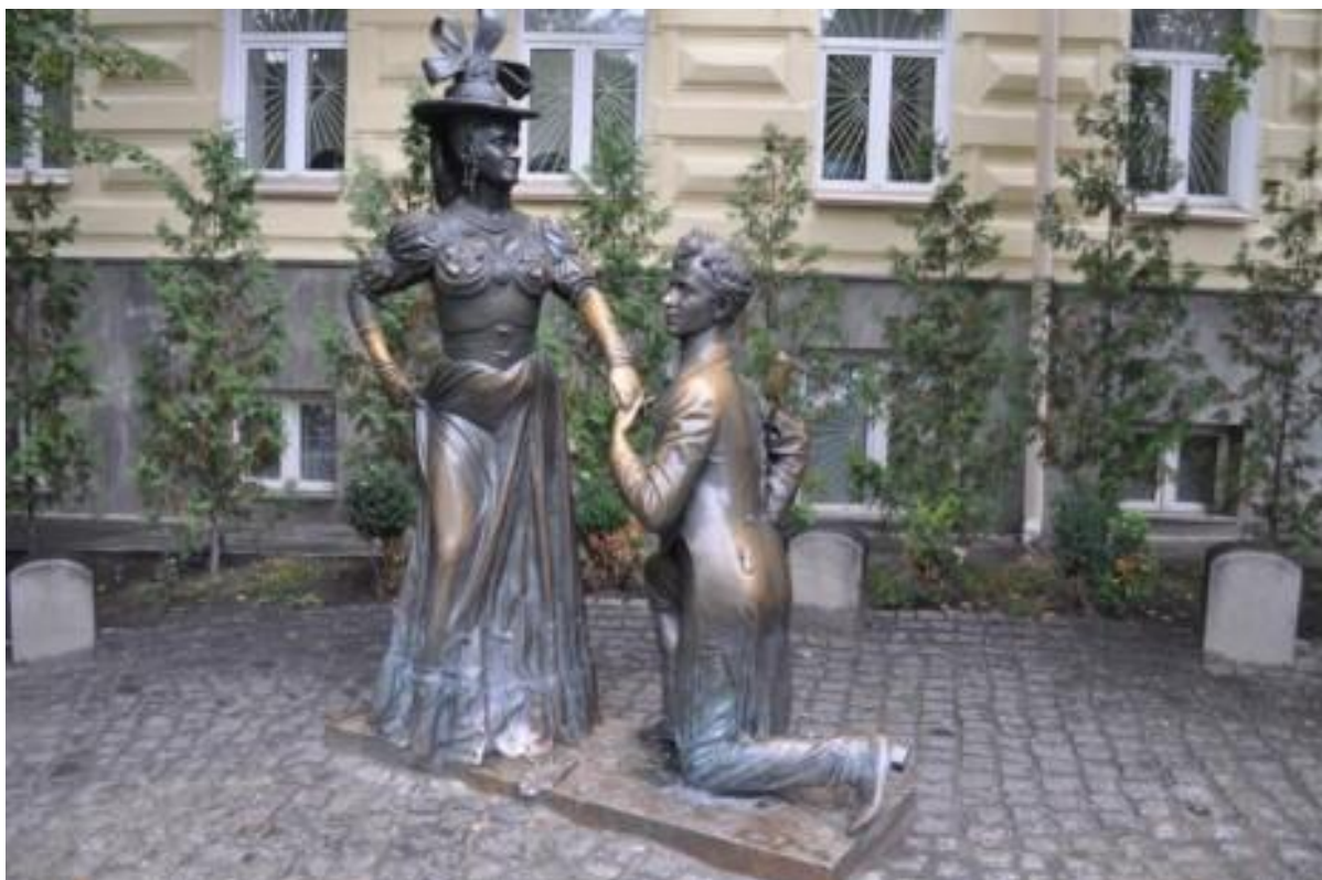
Пам'ятник Проні Прокопівній та Свириду Голохвастову – героям п'єси М.Старицького в Києві