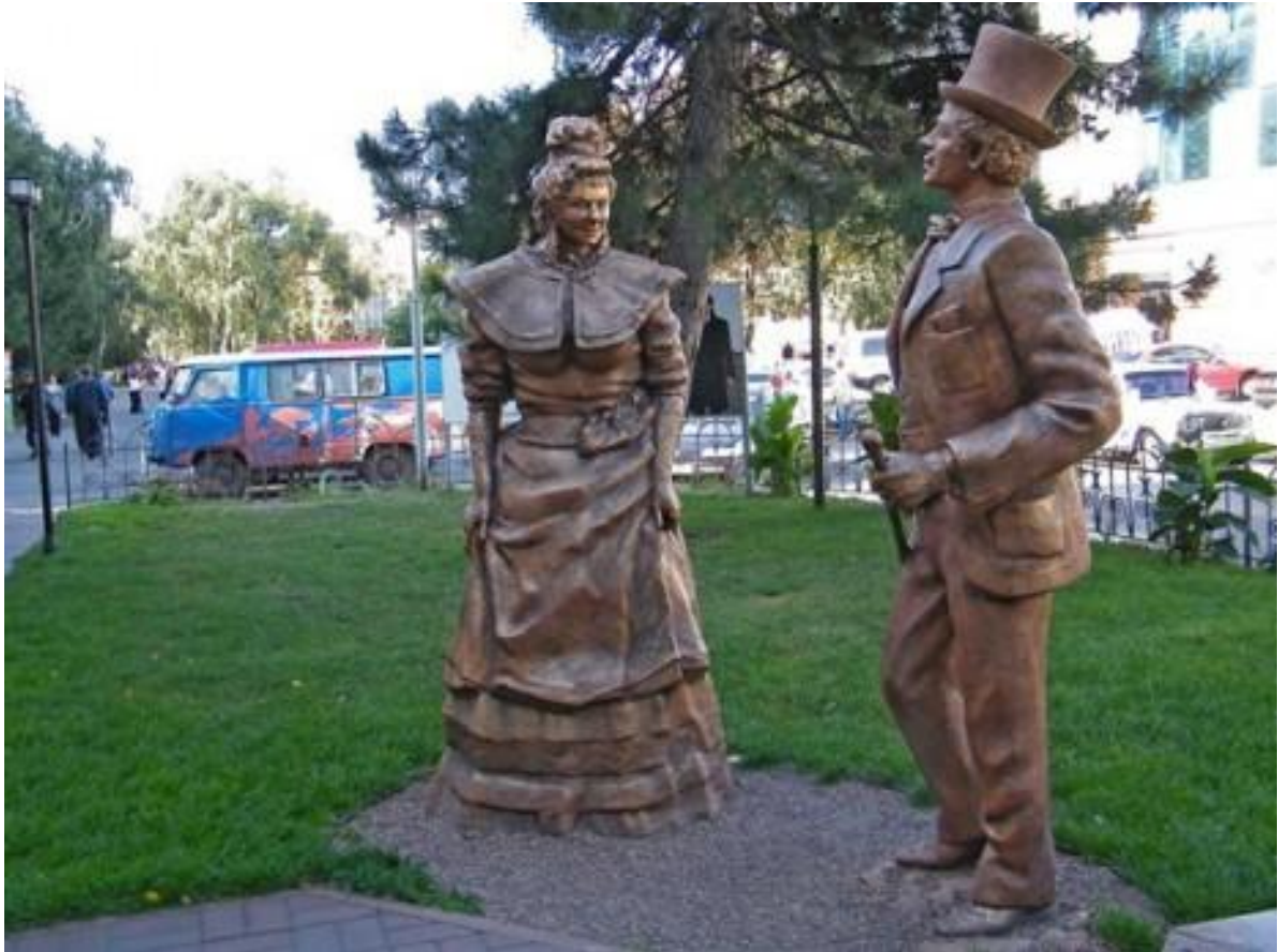
Пам'ятник Проні Прокопівній та Свириду Голохвастову – героям п'єси М.Старицького у Черкасах