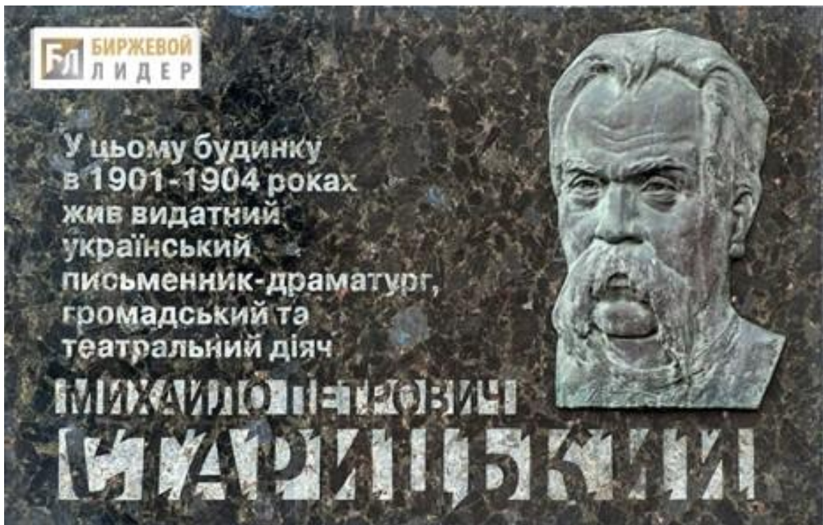
Меморіальна дошка на фасаді будинку в Києві, де проживав М.Старицький