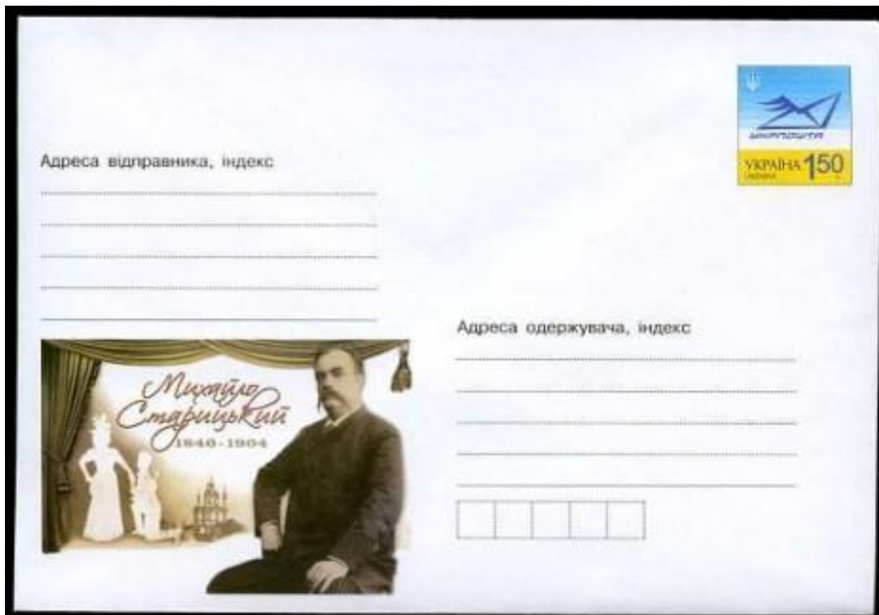
Конверт із зображенням М.Старицького